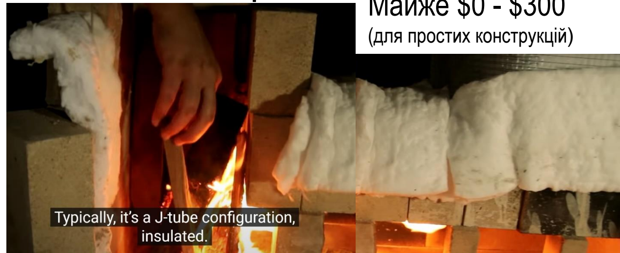
Typically, it's a J-tube configuration, insulated.

Майже $0 - $300 (для простих конструкцій)