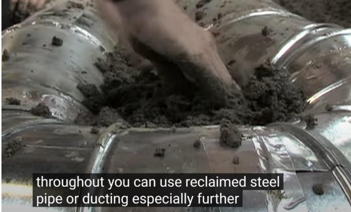
throughout you can use reclaimed steel pipe or ducting especially further